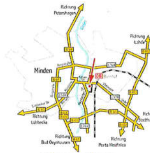
Schwarzer Weg 8, 32423 Minden (Stammsitz)