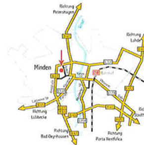
Stiftstr. 35, 32427 Minden