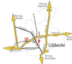
Bahnhofstr. 1A, 32312 Lübbecke