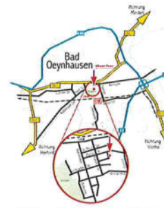
Dr.-Louis-Lehmann-Str. 5, 32545 Bad Oeynhausen